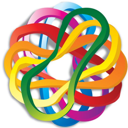
MULTICREA INTERACTIVE SCHOOL of Berlin